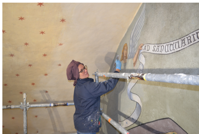
Francesca aux petits soins pour nos angelots

Des peintures et enduits se dégradent fortement suite à plusieurs infiltrations sur le toit de la nef et celui de la chapelle Nord. Il était donc urgent de procéder à la sauvegarde de notre patrimoine commun, et sous la Maîtrise d'œuvre de Delphine DUPLOUY-JALICON, Architecte, les travaux ont débuté au mois de septembre 2021. Un suivi du toit de la nef et une reprise du toit de la chapelle Nord, avec réfection totale des zingueries, ont été réalisés par l'entreprise Verne Charpente. Les enduits et peintures les plus abîmés ont été repris par l'entreprise Samarkande, dont nous tenons à souligner la qualité du travail réalisé, reprenant et sublimant l'existant, dans le pur respect de l'architecture d'époque. Enfin, l'électricité du bâtiment a été entièrement rénovée par la société Morel Electricité. Tous les luminaires ont été changés, l'église a été sonorisée, un système de chauffage radiant a été installé, et, une VMC a été mise en place afin d'assainir l'intérieur du bâtiment. Ces travaux ont donné une seconde jeunesse à l'intérieur de l'église, lui rendant ses couleurs d'antan. Coût des travaux et honoraires : 105 192,70 €. Subventions sollicitées : 71 121,00 € (FIC, DETR et Région). Reste à charge pour la commune : 34 071,70 €. ●