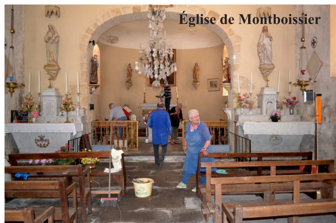
Église de Montboissier

visite guidée du moulin de Fleury ont été l'occasion de repartir du bon pied et de renouer avec notre dynamique de groupe. Les recherches et les sujets traités par notre Association, depuis sa création en 2017, sont consultables en ligne sur le site internet officiel de la