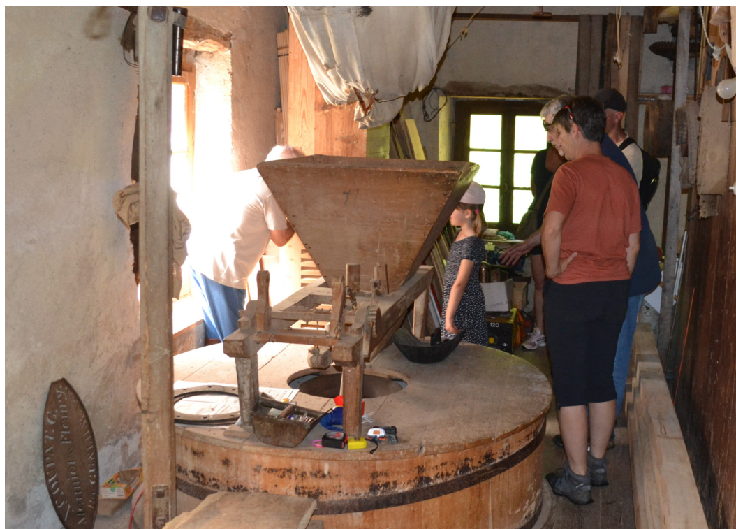
Le moulin de Fleury