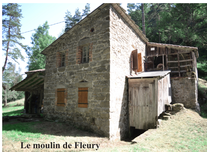
Le moulin de Fleury

convivialité à partager vont repartir de plus belle. Lors de l'Assemblée Générale du 4 octobre 2021, des rencontres mensuelles ont été programmées le deuxième samedi de chaque mois à 17h30, à la salle de la « Buvette ». De plus, notre Association va participer au recensement du petit patrimoine organisé par la Communauté de Commune Ambert Livradois Forez. Le nettoyage de l'Eglise de MONTBOISSIER fin juin et la